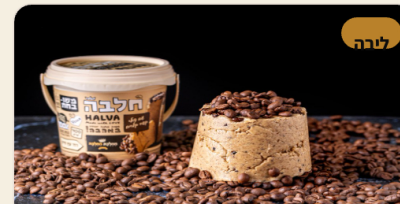
טחינה גולמית טחינה איכותית