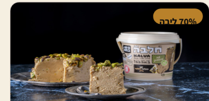
חלבה במשקל מגוון טעמים – נמכרת במשקל