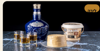
טחינה בטעמים במארזים